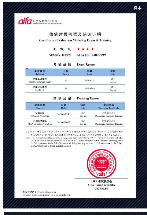
估值建模考试及培训证明